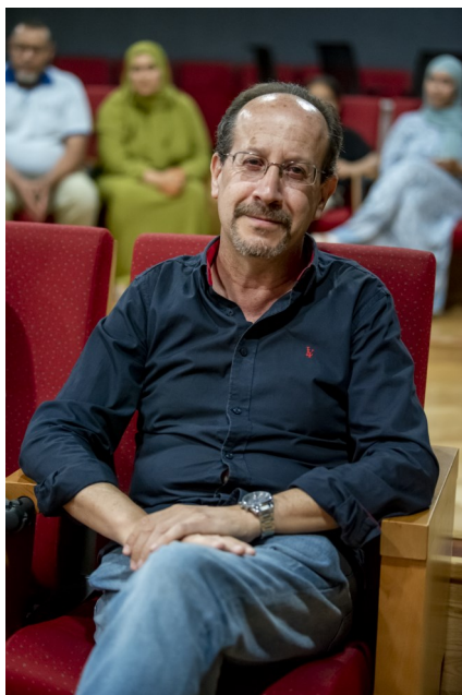
PRIMER PREMIO “Las flores del hinojo en primavera”

El Centro de Cocemfe Albacete Infanta Leonor acogió el acto de entrega del duodécimo concurso de literatura de la Fundación FAMA, un certamen que tiene como lema Superación personal y discapacidad y cuenta con la colaboración de la Fundación Globalcaja Albacete, el diario La Tribuna de Albacete, que publicará los relatos ganadores, y de Juventudes Musicales.