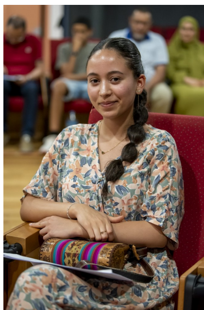
SEGUNDO PREMIO “Pasos de esperanza”